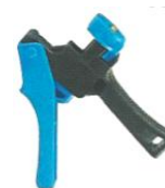
IINS.XXX Mikrocsatlakozó benyomó