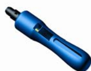
IIFUS.XXX PE-cső lyukasztó Ø 2,5 - 14 mm