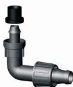
IE.860.XXX Könyök indító gumigyűrűvel