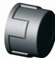
IR.609.XXX Menetes kupak 1/2" - 4"