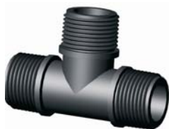
IR.605.XXX KM T-idom 1/2" - 5/4"