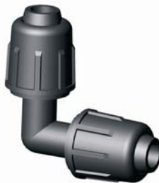
IE.823.XXX Tok-Tok könyök 16 - 40