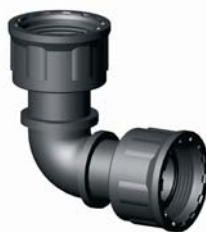
IG.426.XXX BM-BM könyök O-gyűrűvel 1" x 1"