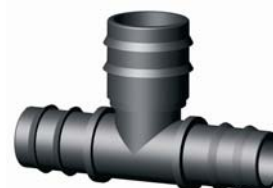
IP.616.XXX Bordás bővítő T-idom 16 x 20 x 16 - 32 x 40 x 32