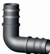
IP.640.XXX Bordás könyök 16 - 90