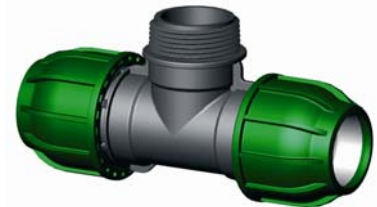
IQ.216.XXX Tok-KM-Tok T-idom 16 x ½" x 16 – 110 x 4" x 110