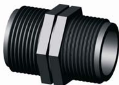
IR.607.XXX Közcsavar 1/2" - 4"