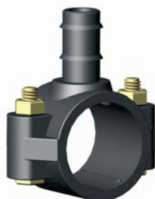
IS.501.XXX Tömlőcsatlakozós nyeregidom 32 x 16 – 32 x 20