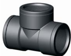
IR.630.XXX BM T-idom 1/2" - 3"