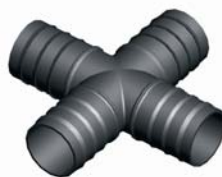
IP.643.XXX Négyes Bordás elosztó 75 x 75 x 75 x 75 - 90 x 90 x 90 x 90