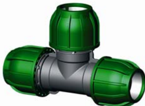
IQ.214.XXX Tok-Tok-Tok T-idom 16 - 110