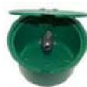
FDCS Fedeles doboz fémcsapal