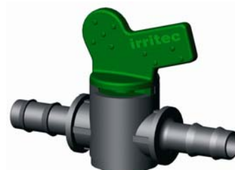
IVVPP.XXX Bordás-Bordás hengeres csap Ø 16 – 25 mm 4 bar