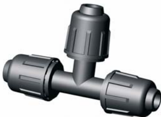
IE.814.XXX Tok-Tok-Tok T-idom 16 - 40