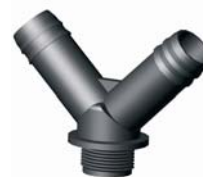
IP.650.XXX Bordás-KM-Bordás Y-idom 16 x 3/4" x 16 - 32 x 5/4" x 32