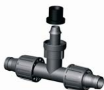
IE.859.XXX T-indító gumigyűrűvel