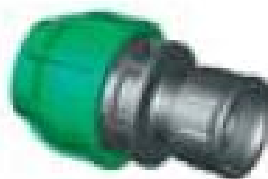
IG.425.XXX Tok – BM hollanderes szelepk. 25 x 1" – 32 x 1"