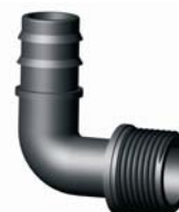
IP.641.XXX Bordás-KM könyök 16 X 1/2" - 40 x 5/4"