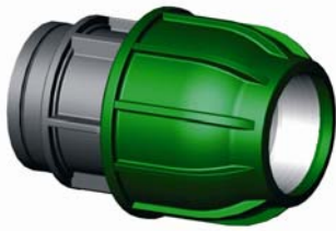
IQ.201.XXX Tok-BM egyenes csatlakozó 16 x ½" – 110 x 4"