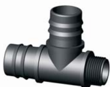
IP.618.XXX Bordás-Bordás-KM T-idom 25 x 25 x 3/4" - 40 x 40 x 5/4"