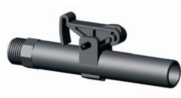
IVCHS.XXX Vízkonnektor kulcs