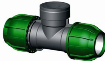
IQ.215.XXX Tok-BM-Tok T-idom 16 x ½" x 16 – 110 x 4" x 110