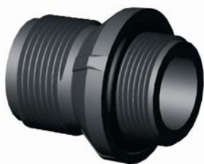
IG.407.XXX Közcsavar O-gyűrűvel 1" x 1"