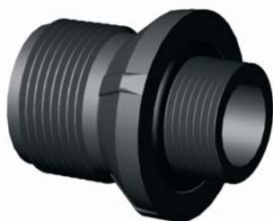
IG.419.XXX Szűkítő közcsavar O-gyűrűvel 1" x 3/4"