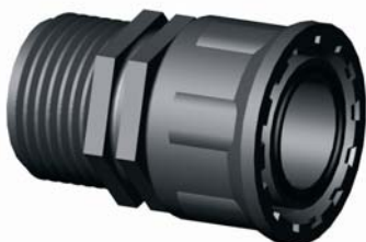
IG.424.XXX KM-BM Toldó O-gyűrűvel 1" x 1"