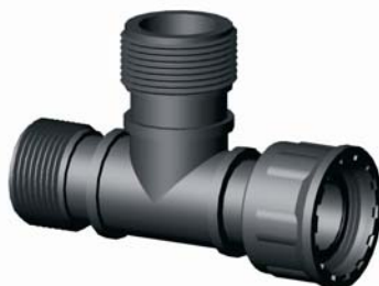
IG.432.XXX KM-KM-BM T-idom 1" x 1" x 1"