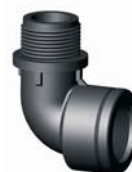
IR.627.XXX BM-KM könyök 1/2" - 1"