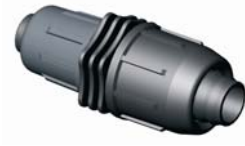
IE.812.XXX Tok-Tok szűkítő 20 x 16 - 40 x 32