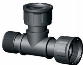
IG.431.XXX KM-BM-BM T-idom 1" x 1" x 1"