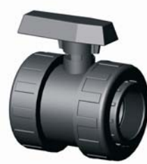
IV.5FF.XXX BM-BM PVC golyóscsap 1" 10 bar