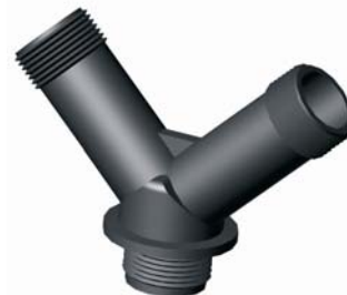
IE.822.XXX KM Y-idom 1/2'' x 3/4'' x 1/2'' - 5/4'' x 5/4'' x 5/4''