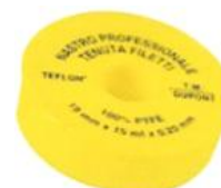
IINAS.XXX Teflonszalag 1/2'' x 12 x 0,076