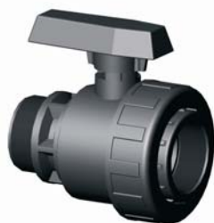
IV.3MF.XXX KM-BM PVC golyóscsap 3/4" – 2" 10 bar