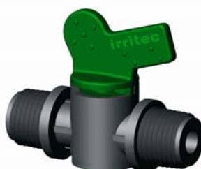
IVVMM.XXX KM-KM hengeres csap Ø 20 – 25 mm 4 bar