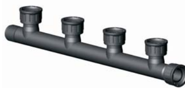
IG.436.XXX KM-BM-BM-BM-BM-BM elosztó 1" x 1" x 1" x 1" x 1" x 1"