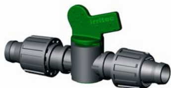
IVVTT.XXX Szalag-Szalag hengeres csap Ø 16 mm 4 bar