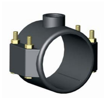
IS.103.XXX BM Nyeregidom 20 X 1/2" - 315 x 4"