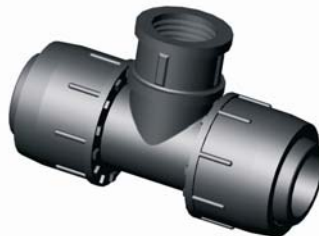
IE.815.XXX Tok-BM-Tok T-idom 32 x 3/4'' x 32 - 32 x 1'' x 32