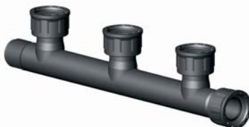
IG.435.XXX KM-BM-BM-BM-BM elosztó 1" x 1" x 1" x 1" x 1"