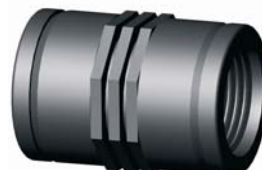
IR.620.XXX Karmantyú 1/2" - 4"