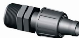
IE.852.XXX KM-indító 1/2'' - 3/4''