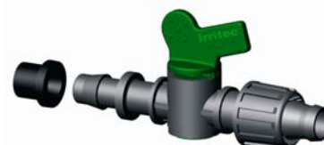
IVVRT.XXX Gumigyűrűs szalag indító hengeres csap Ø 16 mm 4 bar