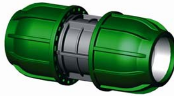
IQ.210.XXX Tok-Tok töldő 16 – 110