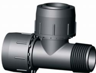
IE.820.XXX Tok-Tok-KM T-idom 25 x 3/4'' x 25 - 40 x 5/4'' x 40