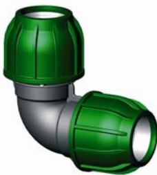
IQ.213.XXX Tok-Tok könyök 16 - 110