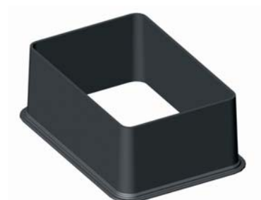
IGEST.XXR Téglalap szelepakna bővítő Standardhoz és Jumbohoz