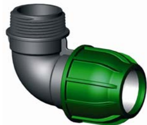
IQ.219.XXX Tok-KM könyök 16 x ½" – 110 x 4"