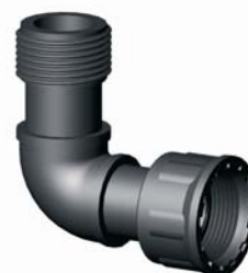
IG.427.XXX KM-BM könyök O-gyűrűvel 1" x 1"