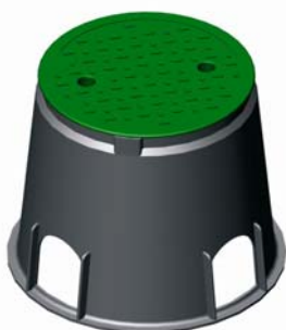
IGPCZ.XXC Kerek Mini, Large