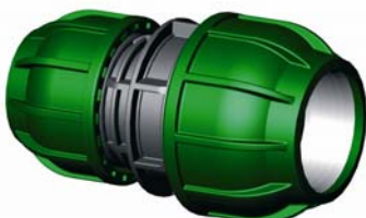
IQ.212.XXX Tok-Tok szűkítő csatlakozó 20 x 16 - 110 x 90