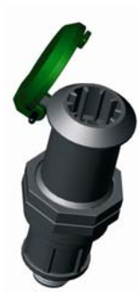
IVIDS.XXX Vízkonnektor alap 3/4" – 1"