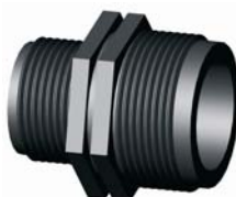
IR.619.XXX Szűkítő közcsavar 3/4" x 1/2" - 4" x 3"