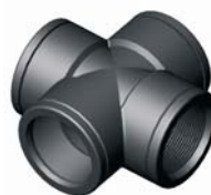
IR.633.XXX BM kereszt idom 1" - 3"