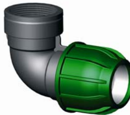
IQ.218.XXX Tok-BM könyök 16 x ½" – 110 x 4"