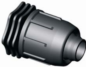
IE.813.XXX Tokos végdugó 20 - 40