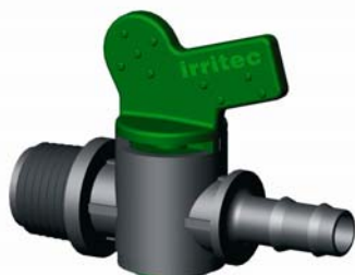
IVVMP.XXX KM-Bordás hengeres csap 16 x 1/2" – 20 x 3/4" 4 bar