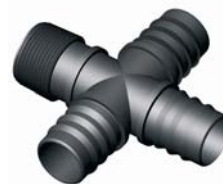
IP.644.XXX Négyes Bordás-Bordás-Bordás- KM elosztó 75x75x75x 2 1/2" - 90x90x90x3"