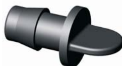
IITRU.XXX PE-cső vakdugó