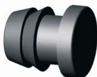
IP.600.XXX Bordás végdugó 16 - 32