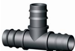
IP.606.XXX Bordás T- idom 16 - 90