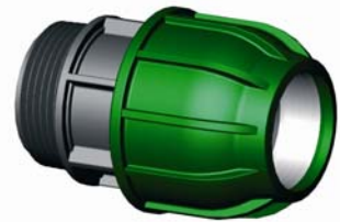
IQ.211.XXX Tok-KM egyenes csatlakozó 16 x ½" - 110 x 4"