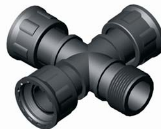
IG.433.XXX KM-BM-BM-BM kereszt 1" x 1" x 1" x 1"