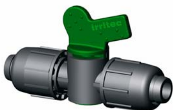
IVVEE.XXX Gyorscsatlakozós hengeres csap Ø 16 – 25 mm 4 bar