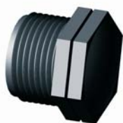
IR.610.XXX Menetes végzáró dugó 1/2" - 4"