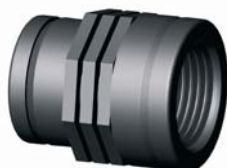
IR.621.XXX Szűkítő karmantyú 3/4" x 1/2" - 4" x 3"