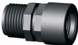
IR.622.XXX KM-BM szűkítő idom 1/2" x 3/8" - 2" x 6/4"