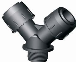
IE.821.XXX Tok-KM-Tok Y-idom 25 x 3/4'' x 25 - 40 x 2'' x 40