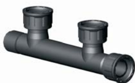
IG.434.XXX KM-BM-BM-BM elosztó 1" x 1" x 1" x 1"