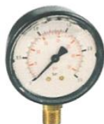
IIPGG.XXX Glicerines nyomásmérő óra 0-2,5 bar, 0-6 bar, 0-10 bar