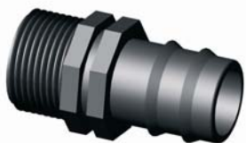
IP.602.XXX KM-Bordás egyenes csatlakozó 16 x 1/2" - 90 x 3"