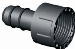
IP.648.XXX Bordás-Tokos idom 16 X 1/2" - 40 x 5/4"