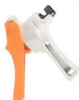
IIFOR.XXX Lay-flat lyukasztó