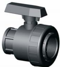
IV.3FF.XXX BM-BM PVC golyóscsap 3/4" – 2" 10 bar