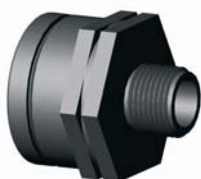
IR.625.XXX BM-KM bővítő idom 1/2" x 3/4" - 6/4" x 2"