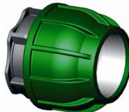
IQ.221.XXX Tokos végdugó 16 - 110