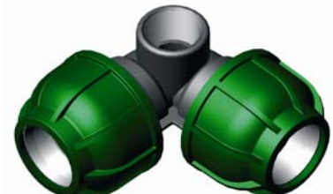
IQ.222.XXX Tok-BM-Tok szórófej könyök 25 x ½" x 25 – 32 x ¾" -32