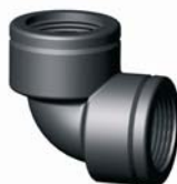
IR.626.XXX BM könyök 1/2" - 3"