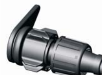
IE.856.XXX Lay-flat indító