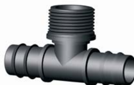
IP.608.XXX Bordás-KM-Bordás T-idom 16 x 1/2" x 16 - 40 x 5/4" x 40