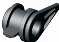
IITLF.XXX Lay-flat vakdugó