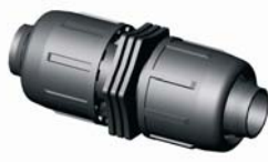
IE. 810.XXX Tok-Tok toldó 16 - 40