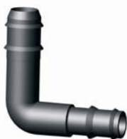
IP.642.XXX Bordás szűkítő könyök 20 x 16