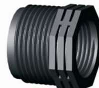
IR.623.XXX KM-BM szűkítő betét 1/2" x 3/8" - 4" x 3"