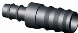
IP.603.XXX Bordás szűkítő toldó 20 x 16 - 40 x 32