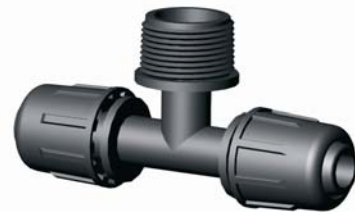
IE.816.XXX Tok-KM-Tok T-idom 16 x 3/4'' x 16 - 40 x 5/4'' x 40