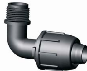
IE.824.XXX Tok-KM könyök 20 x 1/2'' - 40 x 5/4''