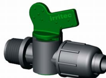
IVVME.XXX KM-gyorscsatlakozós hengeres csap 16 x 1/2" – 25 x 3/4" 4 bar