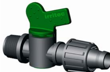
IVVMT.XXX KM-Szalag hengeres csap 1/2" x 16 – 3/4" x 16 4 bar