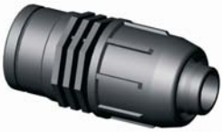
IE.801.XXX Tok-BM egyenes csat. 20 x 3/8'' - 40 x 1''