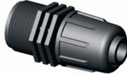
IE.811.XXX Tok-KM egyenes csat. 16 x 1/2'' - 40 x 5/4''