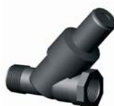
IVPRP.XXX 3/4'' BM-KM nyomásszabályzó 1,1 bar - 1,4 bar (0,8-5m 3 /h)